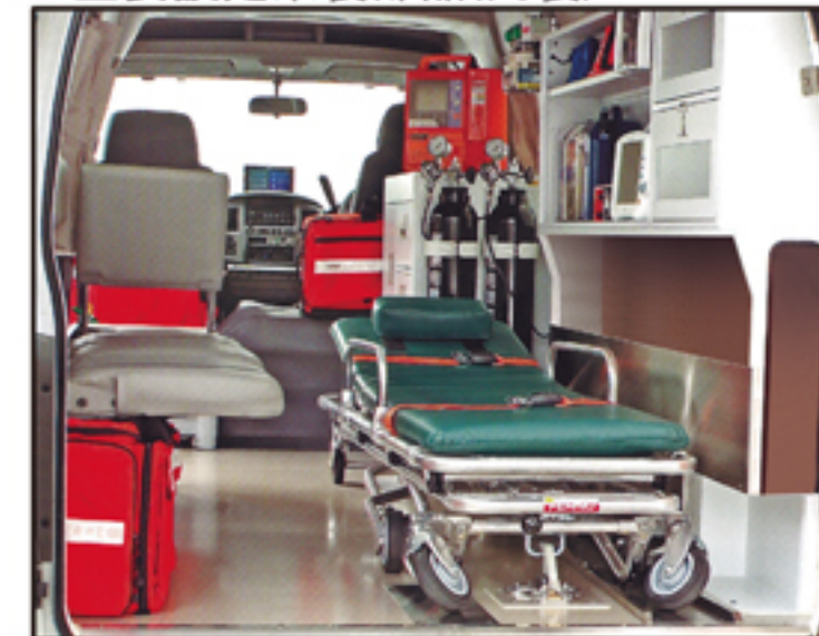
●落ち着いた内装色とメンテナンス性の良い患者室内写真は架装制