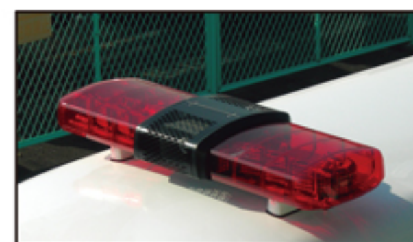
●フロント散光式警光灯