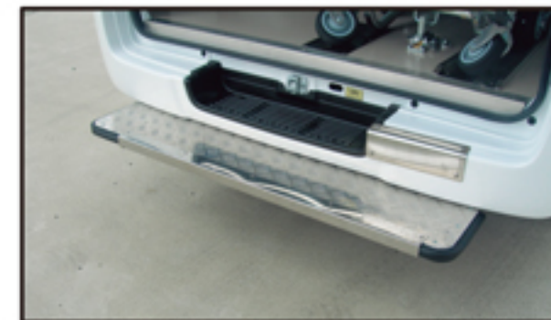
●大型ステップリヤバンパー