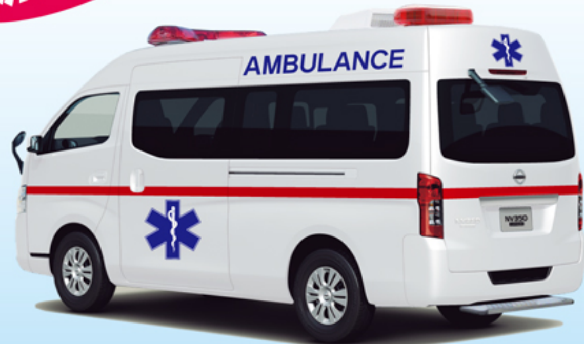
●写真の外観はイメージです。