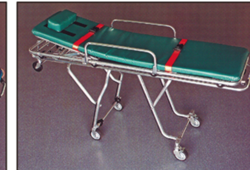
●ファerno製トランスファーストレッチャー(オプション設定)