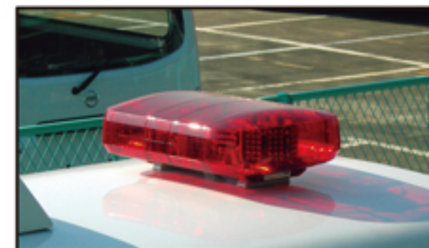
●リヤ散光式警光灯