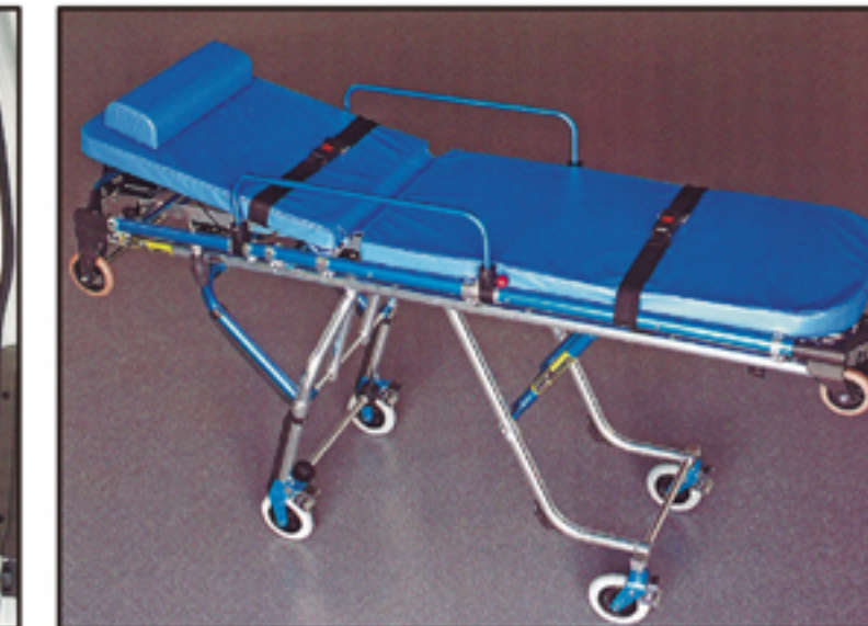
●松永製トランスファーストレッチャー(標準設定)